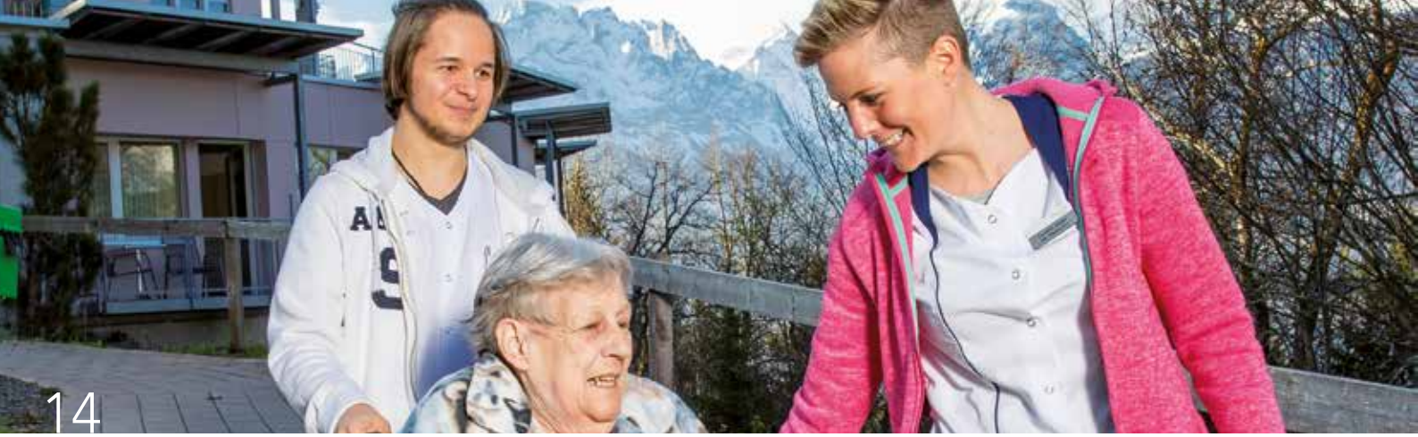
Attraktive Lehrstellen bei der Michel Gruppe.