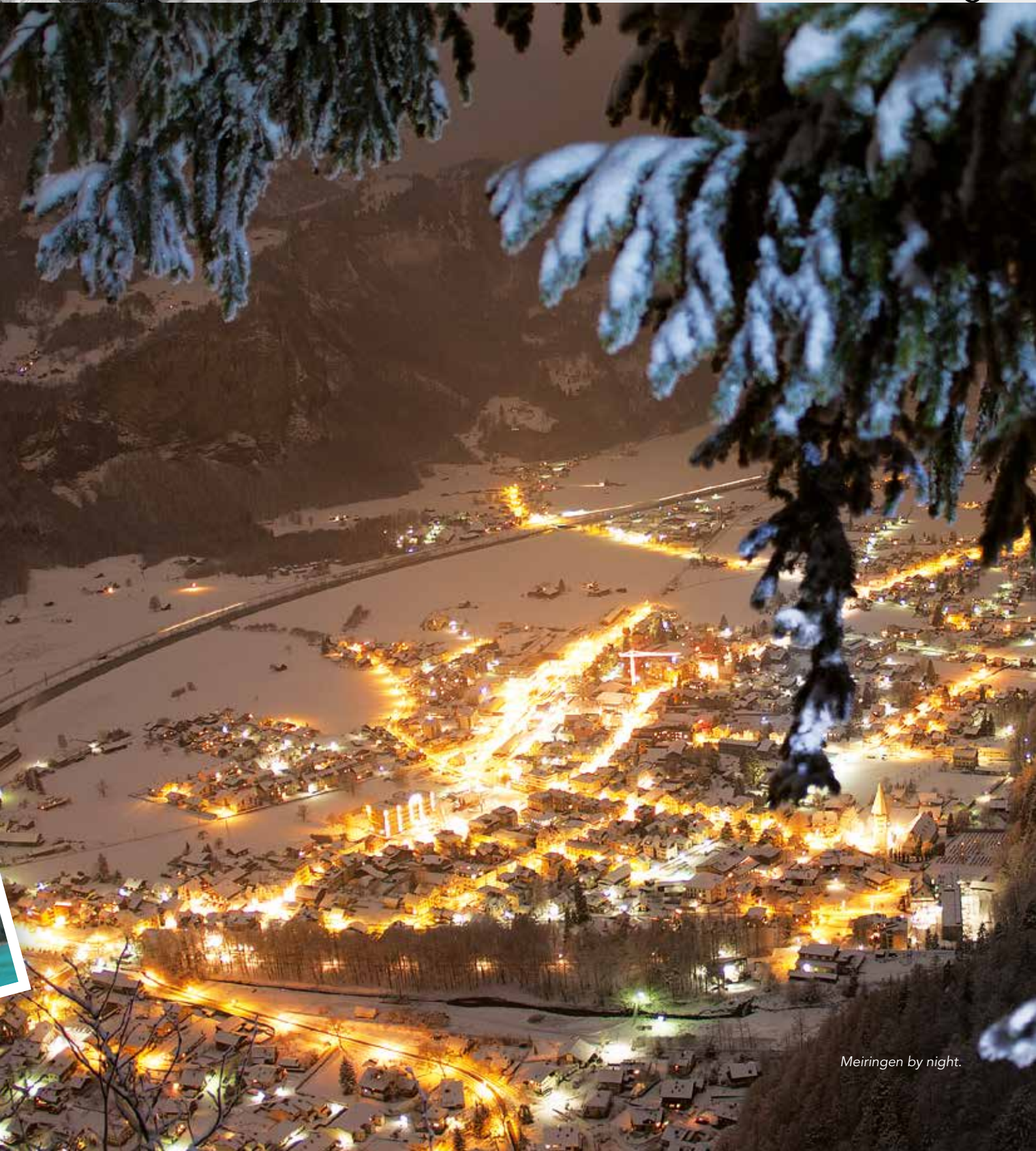
Meiringen by night.