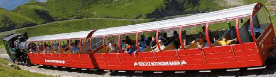
Brienz Rothorn Bahn – älteste Dampfzahnradbahn der Schweiz.