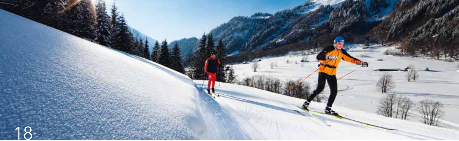
Langlaufen in Gadmen.